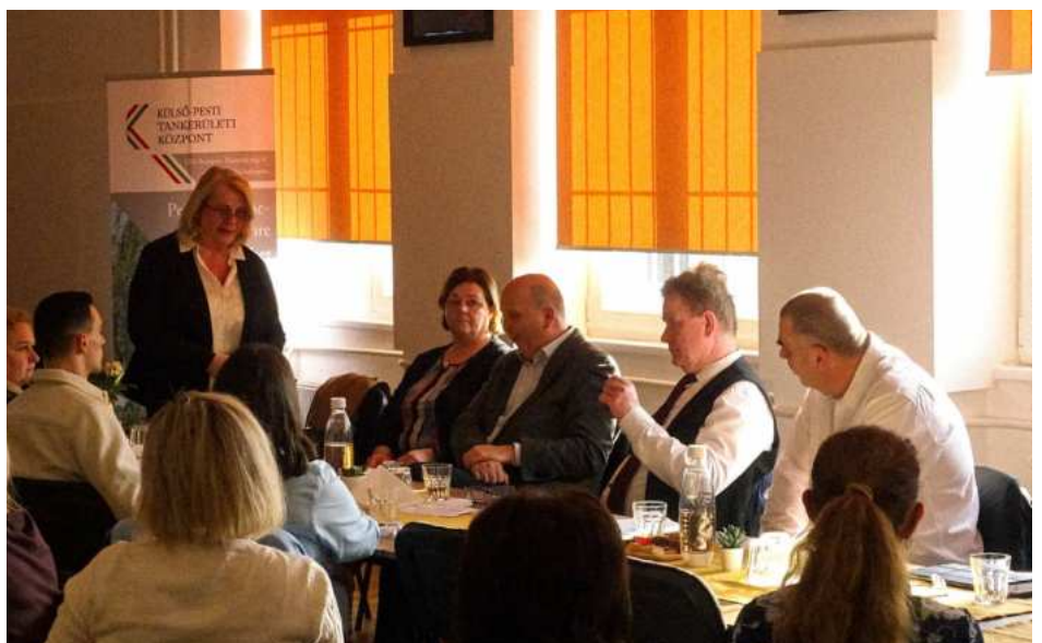
A képen: a XVIII. kerületi gyermekvédelmi szakmaközi megbeszélés

A gyermekek érdekét szolgáló leghatékonyabb együttműködés érdekében szakmaközi megbeszélésre hívtuk a kerületek iskolaigazgatóit, a Rendőrkapitányság vezetőit, a Kormányhivatal és Gyámhivatal vezetőit, valamint a Család és Gyermejköléti Szolgálat és Központ vezetőit. A megbeszélés célja a jelzések minél pontosabb, szakszerűbb körülírása volt, annak érdekében, hogy a gyermek és családja minél hamarabb, minél hatékonyabb, szakszerűbb segítséget kaphasson. Mindannyian elköteleztettek vagyunk, hogy az esetleges bántalmazások, elhanyagolások, a gyermek bármilyen veszélyeztetését előidézö körülmények, melyek akár a családban, akár az intézményben, akár a kortárs csoportban történnek, minél rövidebb időn belül feltárujanak. A szakemberek egységesen képviselték, hogy a hatékony együttműködés adja a kulcsát a veszélyeztetö tényezöök prevenciójának, a probléma megfelelő kezelésének.